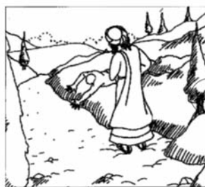
a te Istenedet,