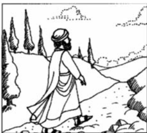
Szeresd az Urat,