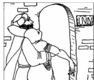
teljes erődből és teljes elmédből,